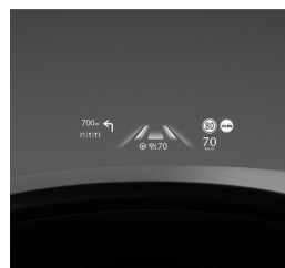
CZYSTA PRZYJEMNOŚĆ PROWADZENIA

Czysta przyjemność prowadzenia. Wnętrze każdego modelu Mazdy charakteryzuje szlachetny minimalizm, dlatego żadne dodatkowe bodźce nie rozpraszają uwagi kierowcy, który może w pełni skupić się na prowadzeniu i czerpać z niego maksimum przyjemności.